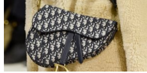
TRENDY TOREBKI JESIEŃ ZIMA 2018

- Moja działalność twórcza opiera się na potrzebie łączenia mody ze sztuką. Nie wyobrażam sobie życia bez przeglądania pięknie zaprojektowanych magazynów pachnących farbą drukarską. To one inspirują mnie zarówno pod względem treści wizualnych jak i struktury papieru. Świadomie wykorzystuję sposób wycinania elementów i to właśnie kształtuje moje surrealistyczne kolaże - pisze artystka w swoim credo. - Inspiruję się porządkiem. Ogromne znaczenie odgrywają także rzeczywiste porządki odwiedzanym miejsc, tu w Polsce, ale przede wszystkim Paryżu. Porządek butików, muzeów i samego miasta o strategicznym znaczeniu historycznym wpływa na to jak postrzegam rzeczywistość, którą następnie obrazuję - wyznaje Machnio - Nie interesuje mnie malowanie rzeczy zwykłych, a mimo to sięgam po obrazy, które mam pod ręką. Coraz częściej decyduje się też na zdobywanie archiwalnych artefaktów z dziwacznych targowisk czy prowincjonalnych bazarków.