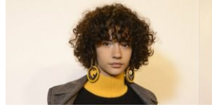
MODNE STYLIZACJE WŁOSÓW NA JESIEŃ 2018

Stale powracający motyw w pracach Machnio to modelka, fashionista. Sprawia to, że jej sztukę postrzegam jako coś silnie powiązanego ze stereotypami. Wiza osoby podążającej za trendami wpisuje się w konwencję konsumpcjonizmu, tematu mocno wyeksploatowanego przez artystów. Mimo to, dostrzegam w kolażach moodboardową, nowatorską wartość - umiejętność rejestracji aktualnych fascynacji i tymczasowych zachwyty. Jej prace pozostają autentyczne, a nawet stanowią o osobistym podejściu do kreowanej rzeczywistości.